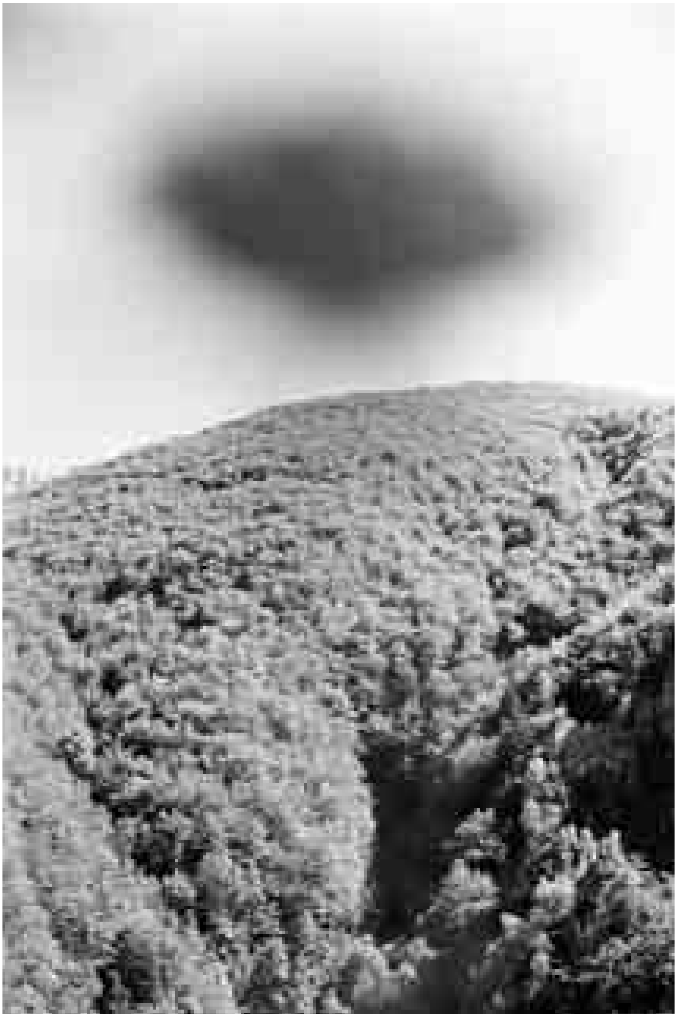
Stefan Jäggi: Foto aus der Serie Centovalli , 2005