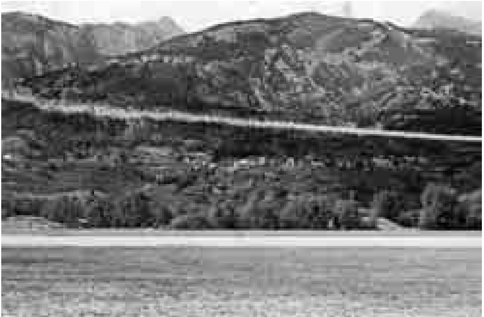
Stefan Jäggi: Foto aus der Serie Flugtag , 2003