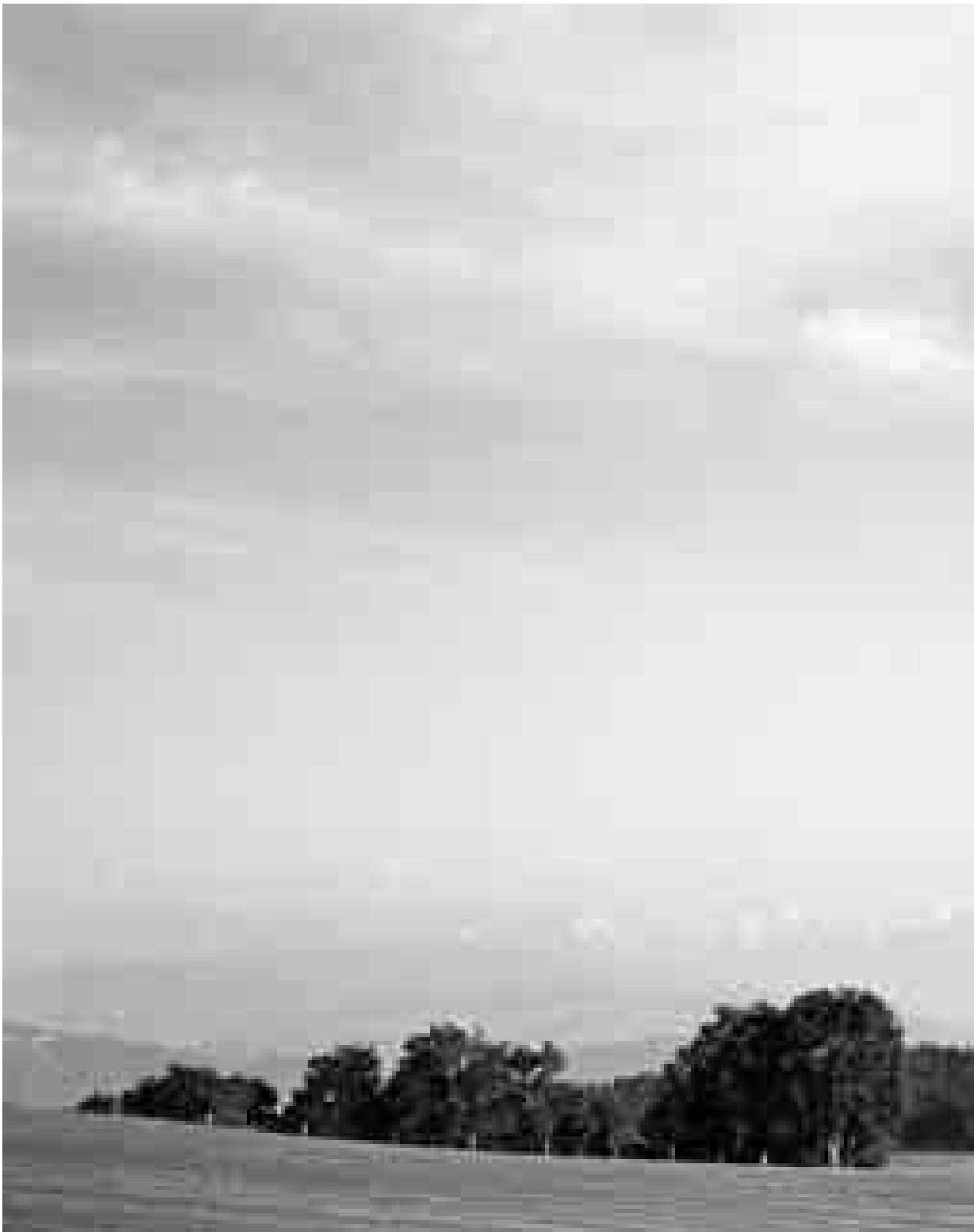
Peter Wüthrich: Foto aus der Serie Imago , 1996