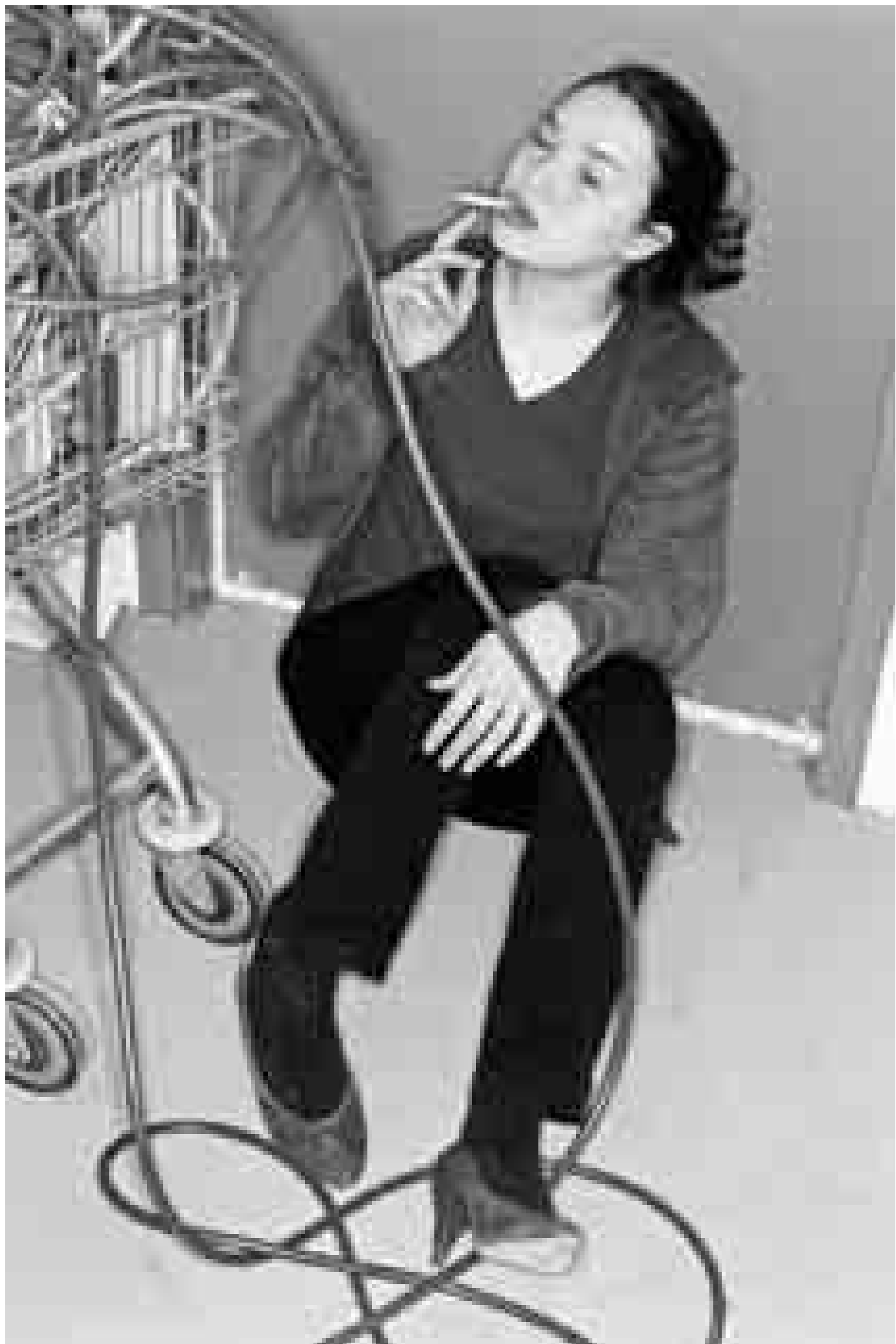
Stefan Jäggi: Portraits 1, 2006