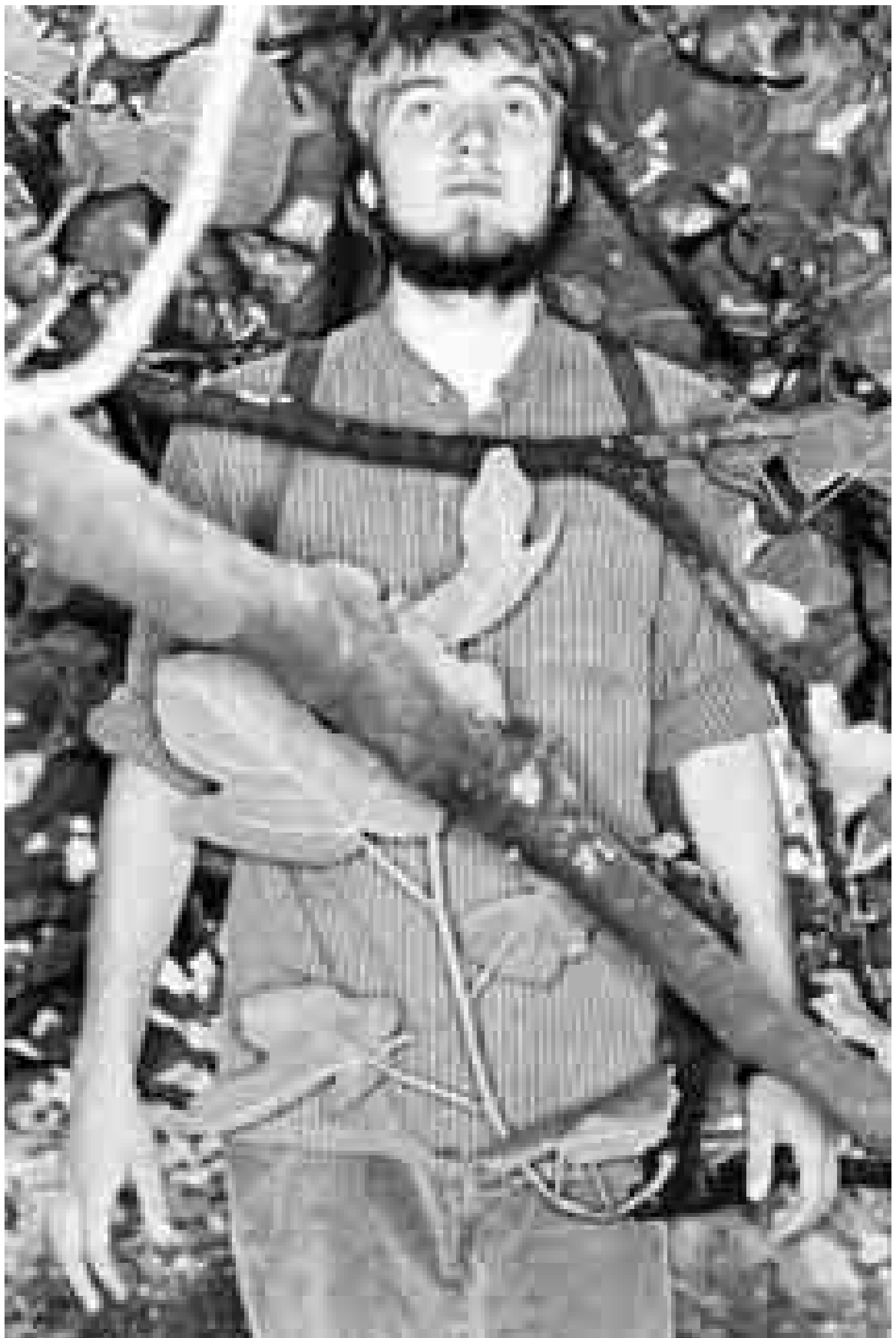
Stefan Jäggi: Portraits 2, 2005