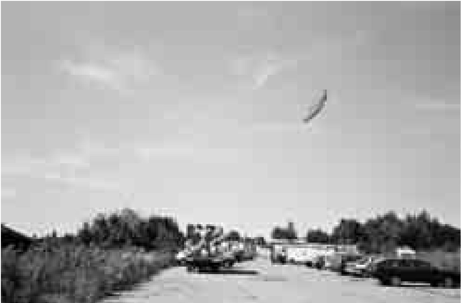
Peter Wüthrich: Foto aus der Serie Imago , 2000