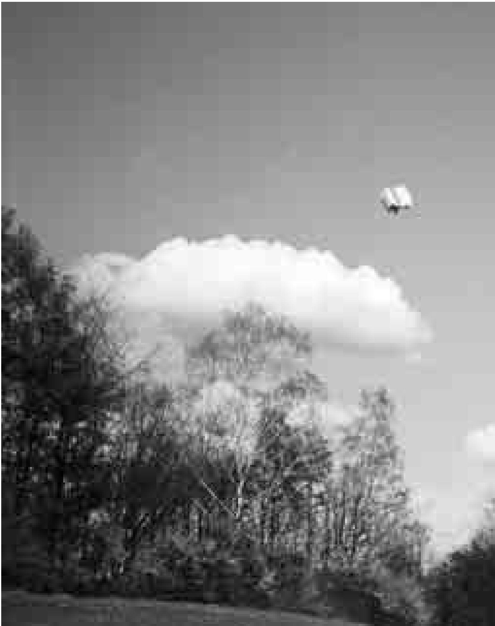
Peter Wüthrich: Foto aus der Serie Imago , 2000