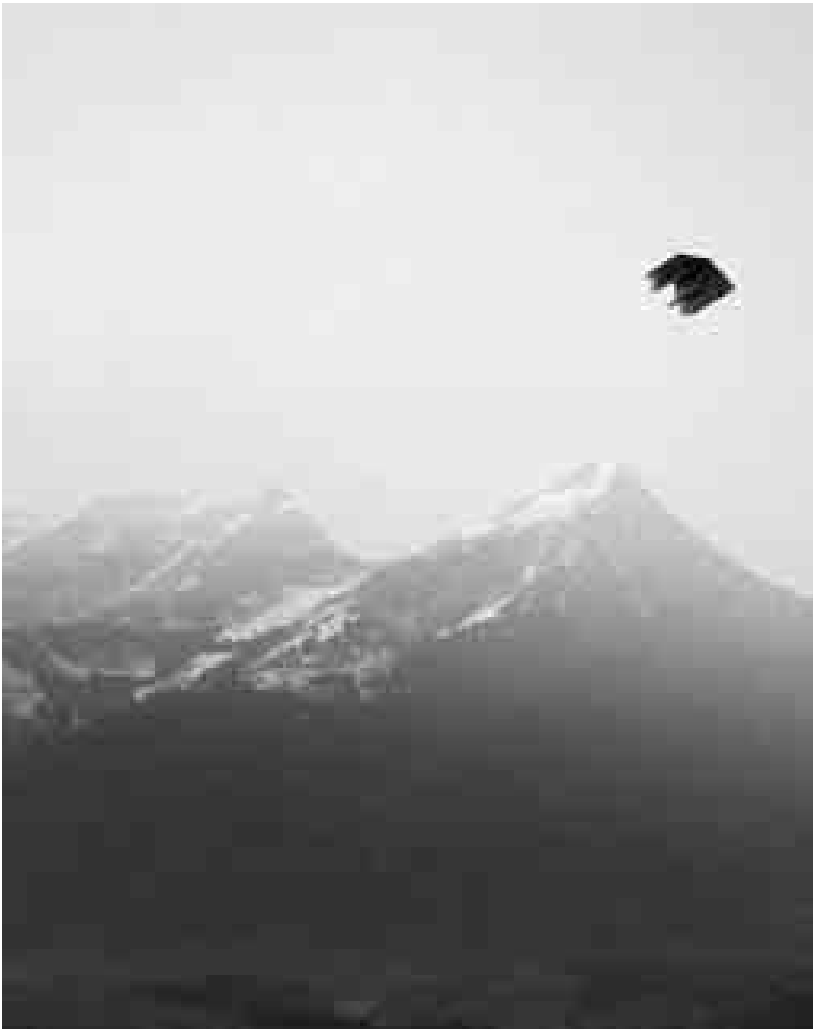
Peter Wüthrich: Foto aus der Serie Imago , 1996