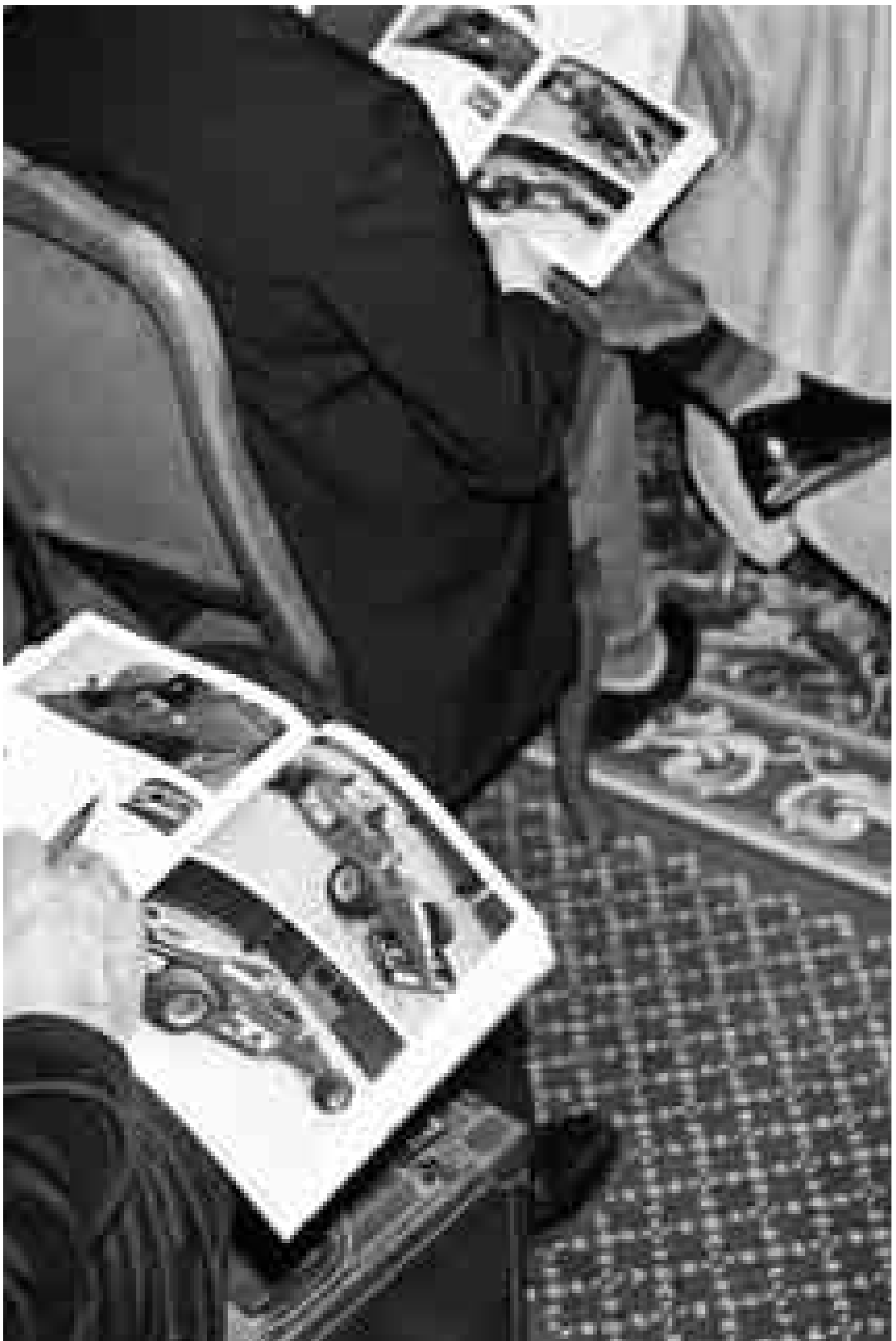
Stefan Jäggi: Foto aus der Serie Ferrari , 2004