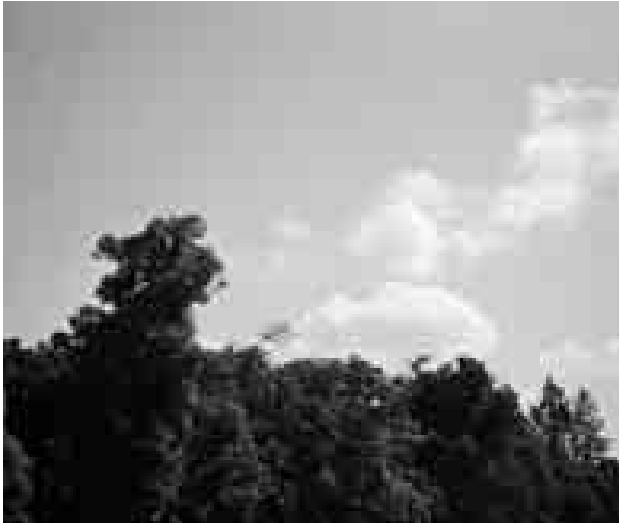
Peter Wüthrich: Foto aus der Serie Imago , 2000