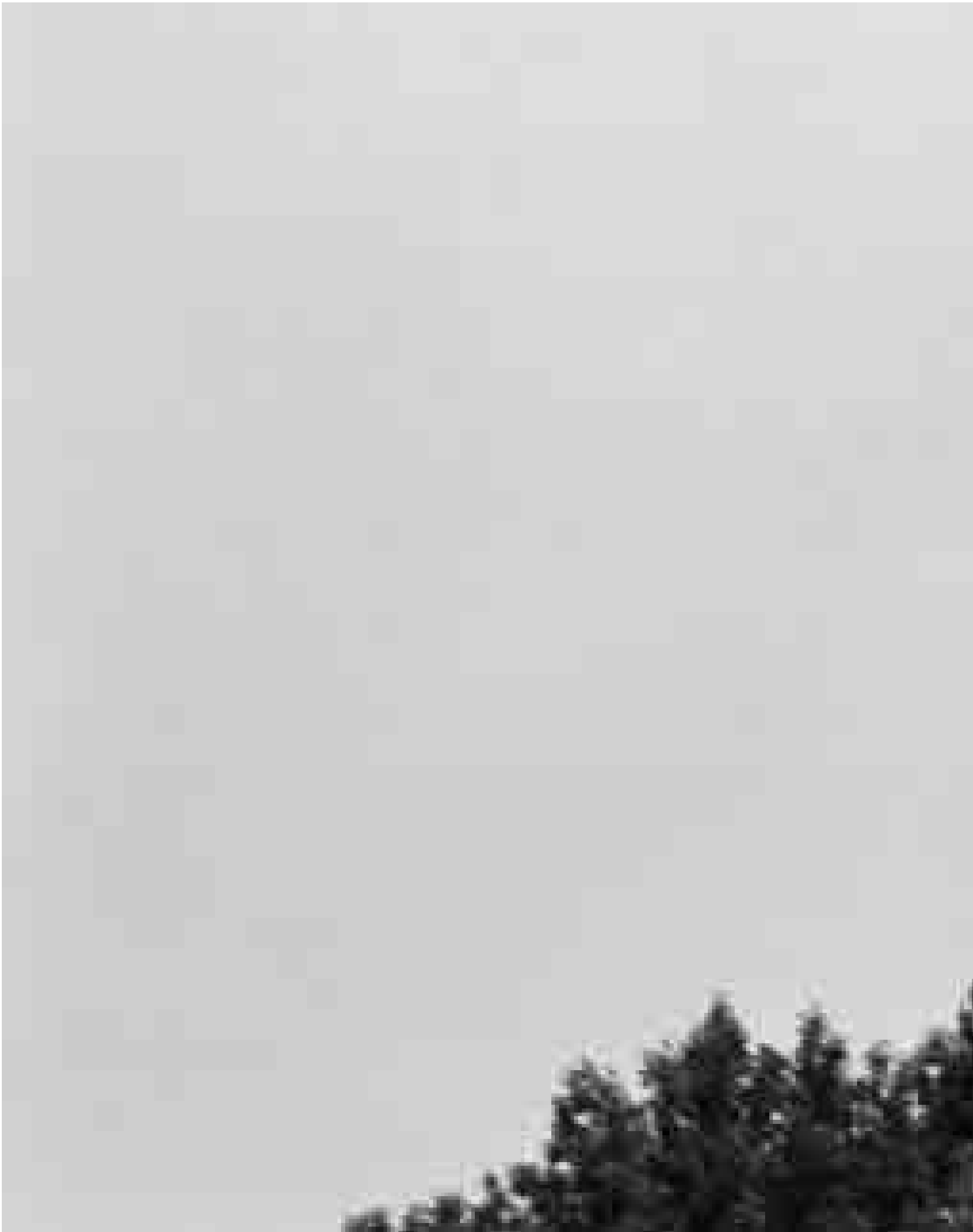
Peter Wüthrich: Foto aus der Serie Imago , 1994