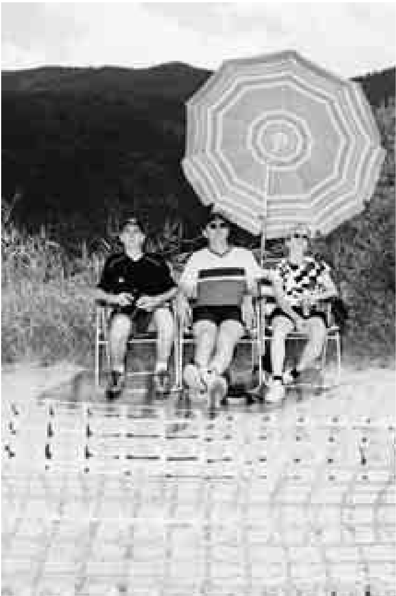
Stefan Jäggi: Fotos aus der Serie Flugtag , 2003