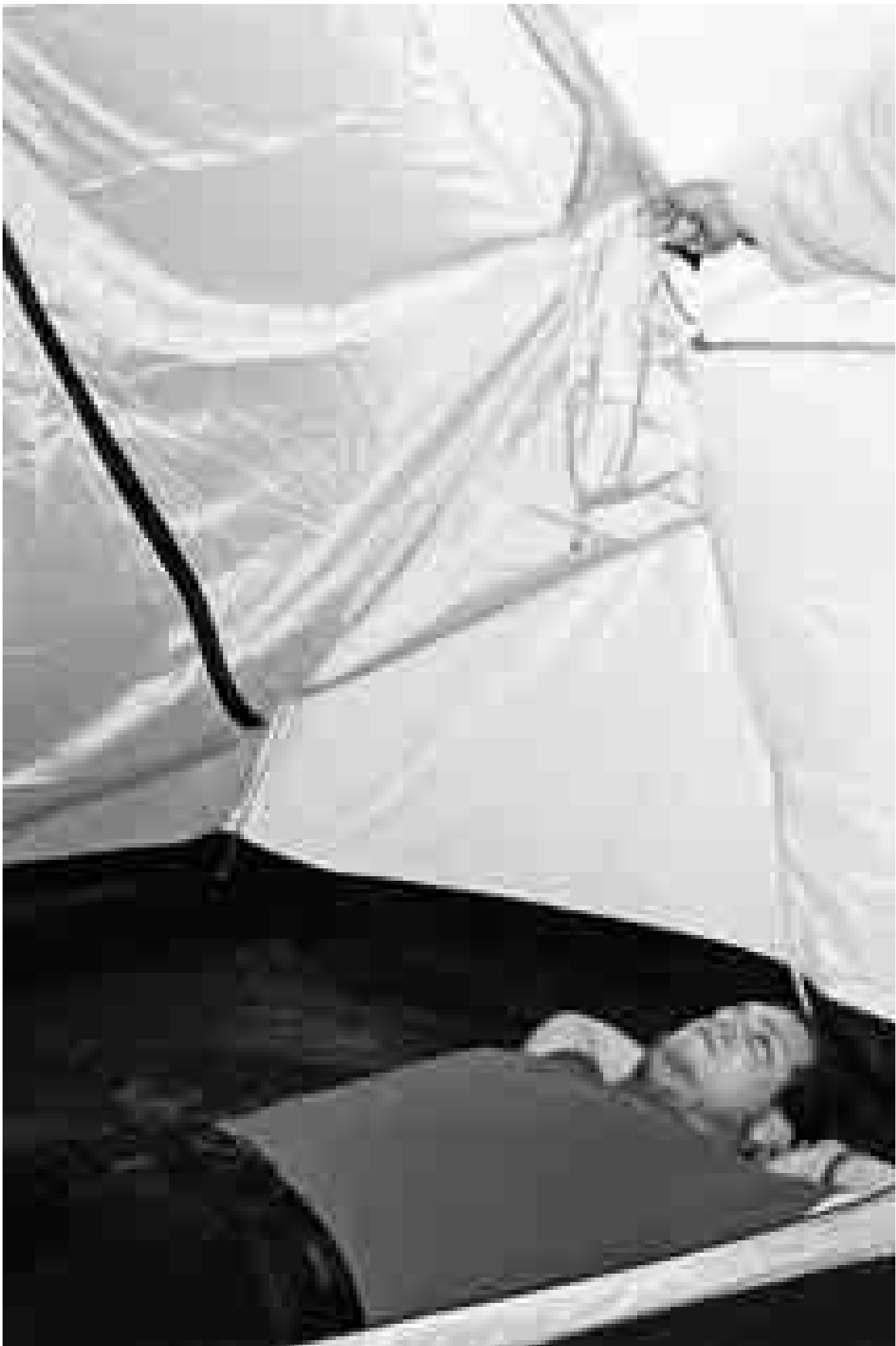
Stefan Jäggi: Foto aus der Serie Camper , 2004