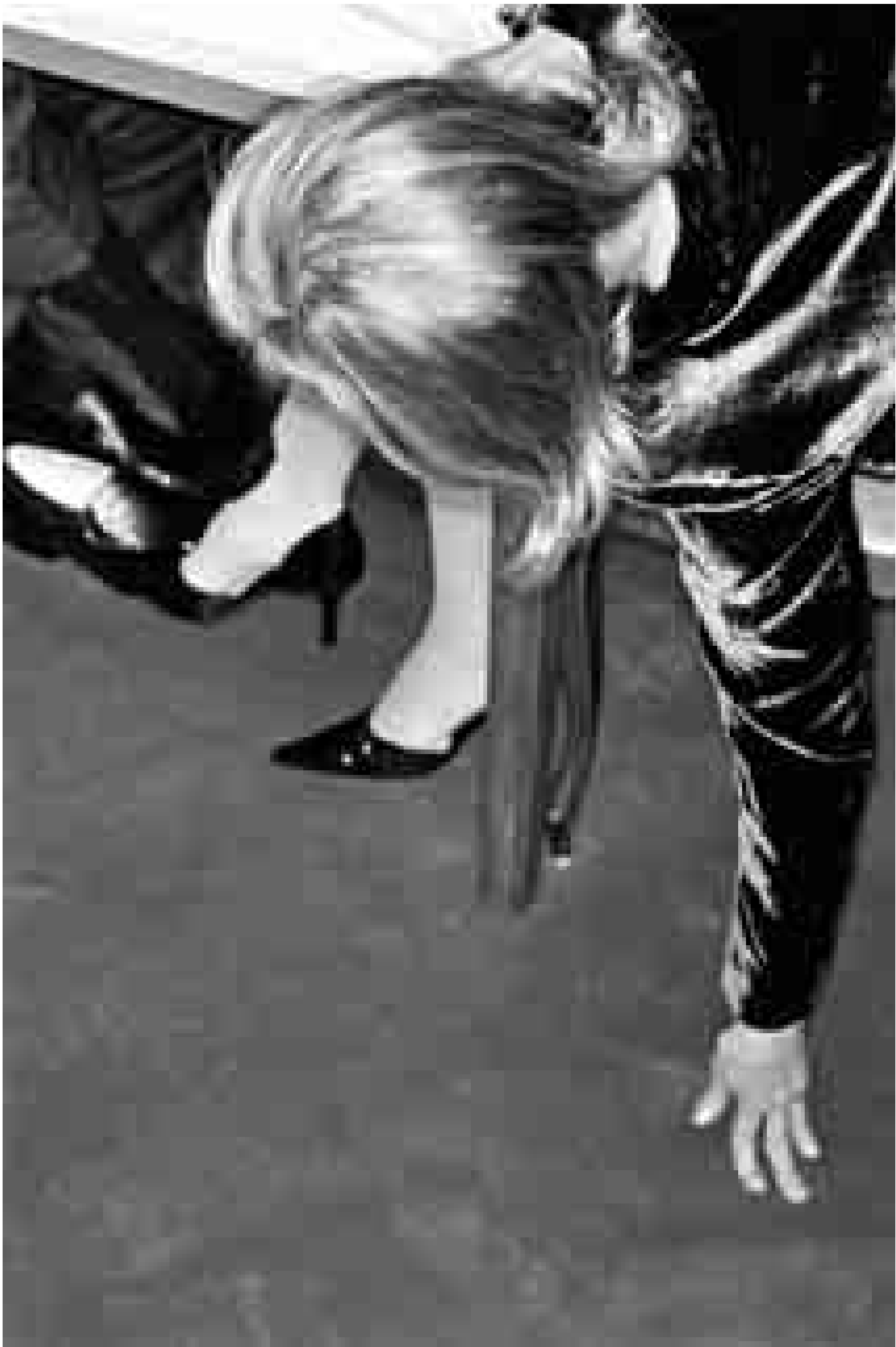
Stefan Jäggi: Foto aus der Serie Soap, 2005